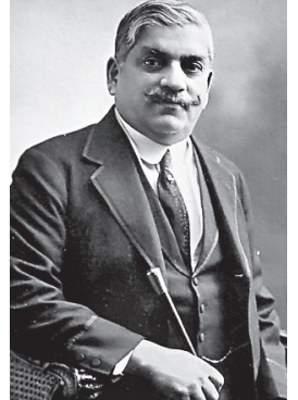
વિદેશીને છાંયે એવો પોષાક, વ્યકિતલ અને એવી છતા એટલે સર સયાજીરાવ.