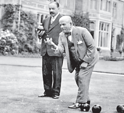
વડોદરા રમતપ્રેમી નગરી બની એના મૂળમાં સર સયાજીરાવનો રમતપ્રેમ જ કારણભૂત છે એવું દર્શાવી તસવીર.