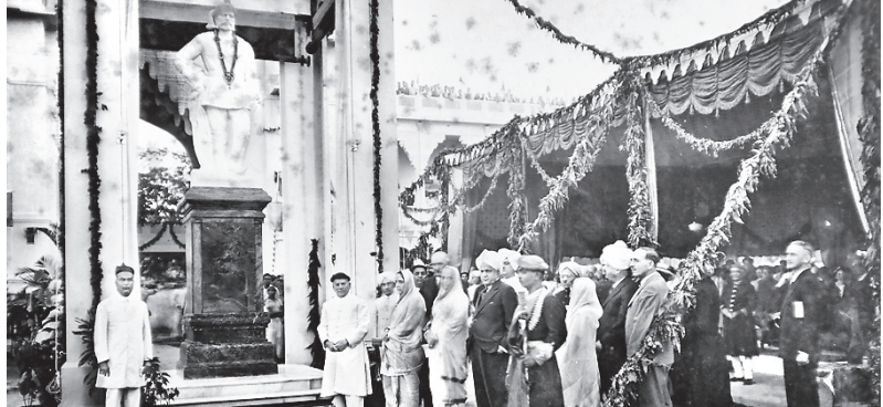
વેમને એમણે જોયા પણ ન હતાં અને તેમનું નિઃસંતાન અવસાન થવાને કારણે નિવાટીએ રાવવી પરિવારને સંતાન દત્તક લેવાના સંજોગમાં મૂક્યું એ પિતા ડૉ.પંડેરાવ મહારાવની પ્રતિમાનું અનાવરણ કરતાં સયાજીરાવ.